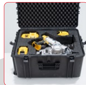
Mallette de transport.