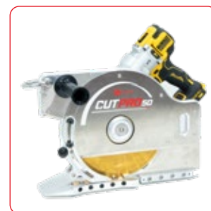
Bandes jusqu'à 51 mm (2') d'épaisseur.