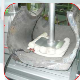
Système de pression au moyen de sac et de plaque d'appui.

Les manœuvres nécessaires pour l'ajustement du pneu sur la machine sont réalisés facilement grâce au contrôle à distance pourvu par la télécommande. De ce fait, vous pouvez régler sans effort aussi bien le bras supérieur tout comme la plaque avant de la machine vous permettant d'adapter rapidement et sans effort la zone à réparer.