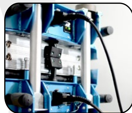
Connexions indépendantes sur les plateaux de E-KOMP 800x500 230V 16A