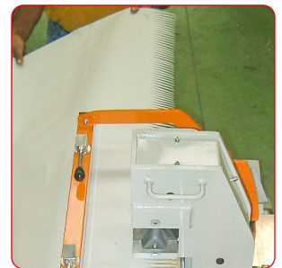
Offene Enden für breitere Bänder.