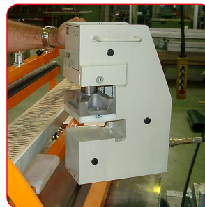
Abnehmbarer Kopf für einfachen Transport.