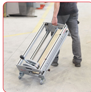
Eingebaute Räder für einfachen Transport.