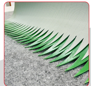
Doppeltes Stanzen, ohne dass das Band manipuliert werden muss.