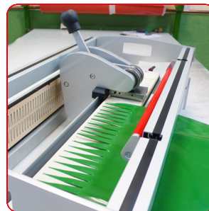
Hervorragender Halt selbst bei dünnsten Bändern.