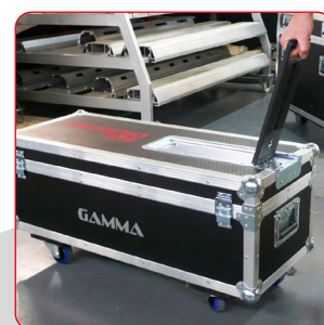
Boîte de transport sur roulettes incluse.