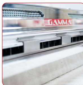
Refroidissement par air.