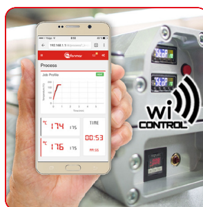
Possibilité d'intégrer le système Wi-Control (en option).