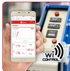
Möglichkeit der Integration von Wi-Control (optional).